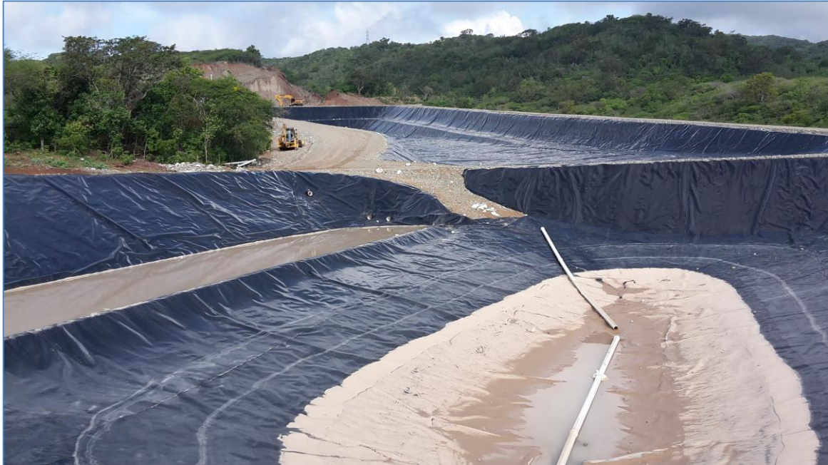
Colocación de tubos de drenaje, Relleno Sanitario.