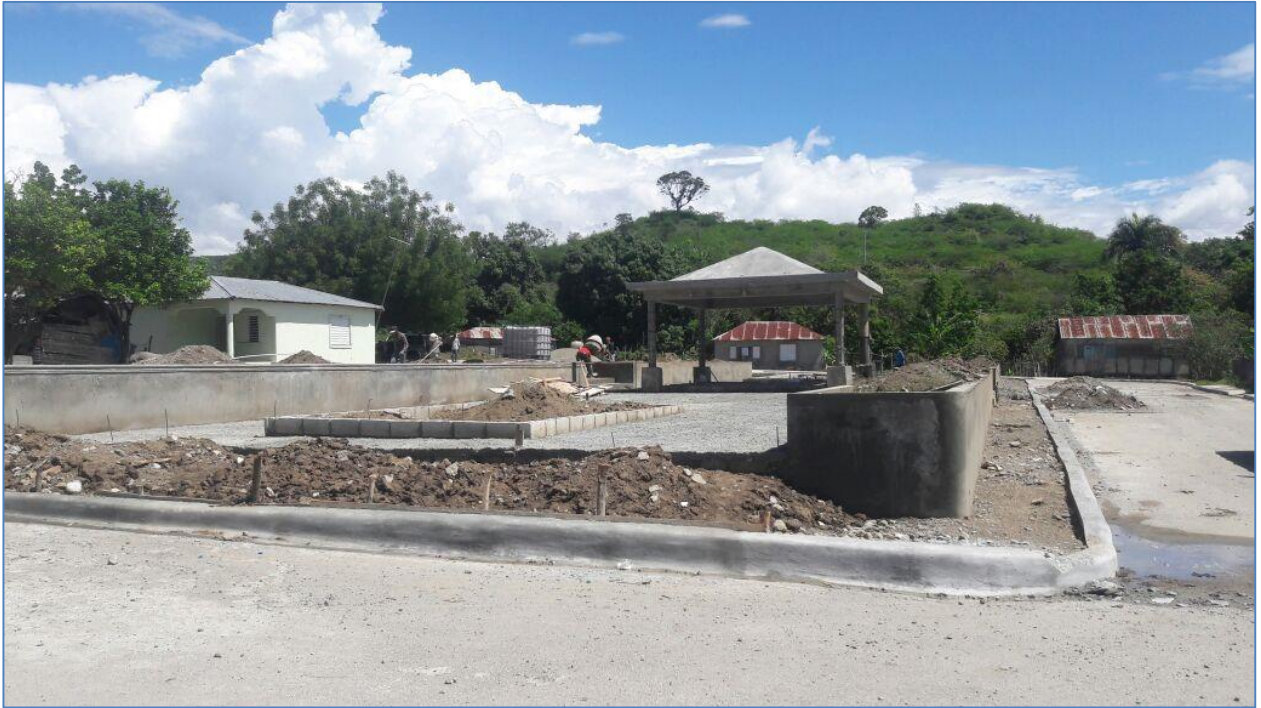
Vista general, Parque Los Cocos.