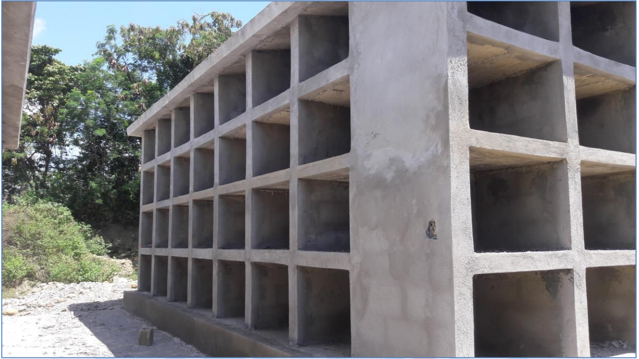
Pañete Exterior de Nichos, Cementerio de Baitoa.