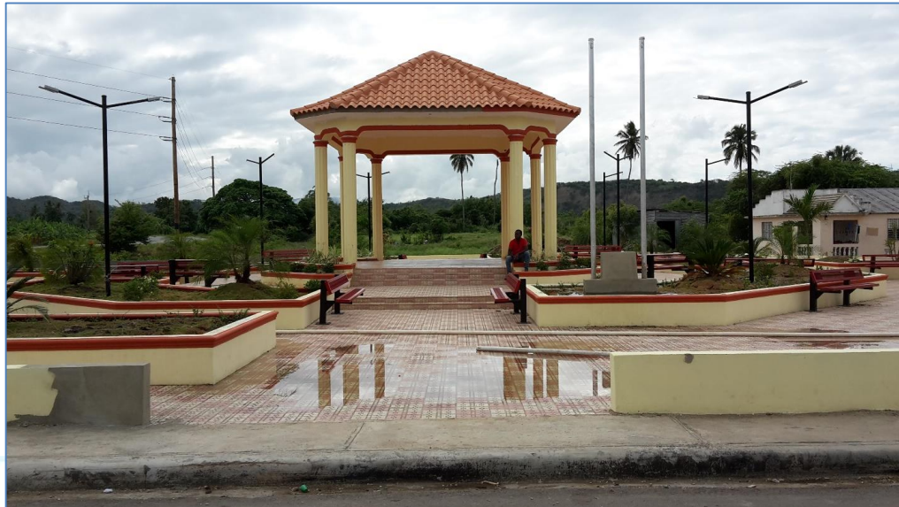
Glorieta, Parque Los Bancos.