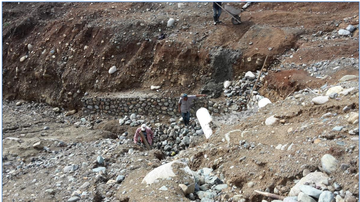
Encache en salida de lixiviados, Relleno Sanitario Bohechío.