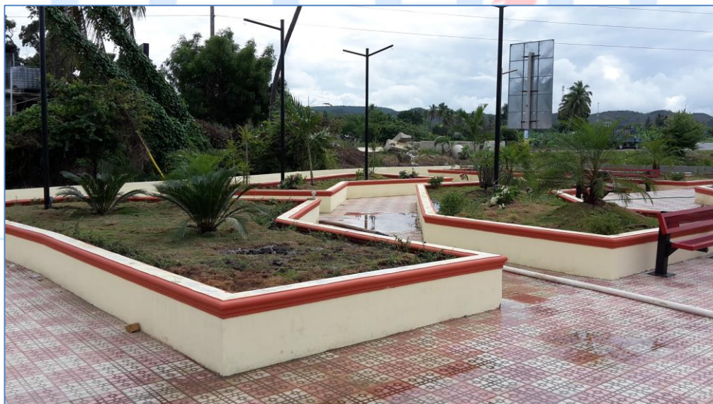
Árboles y plantas colocadas, Parque Los Bancos.