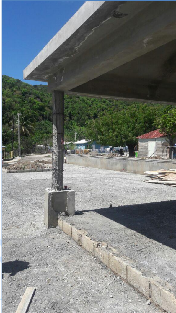
Construcción de pedestales de columnas, Parque Los Cocos.