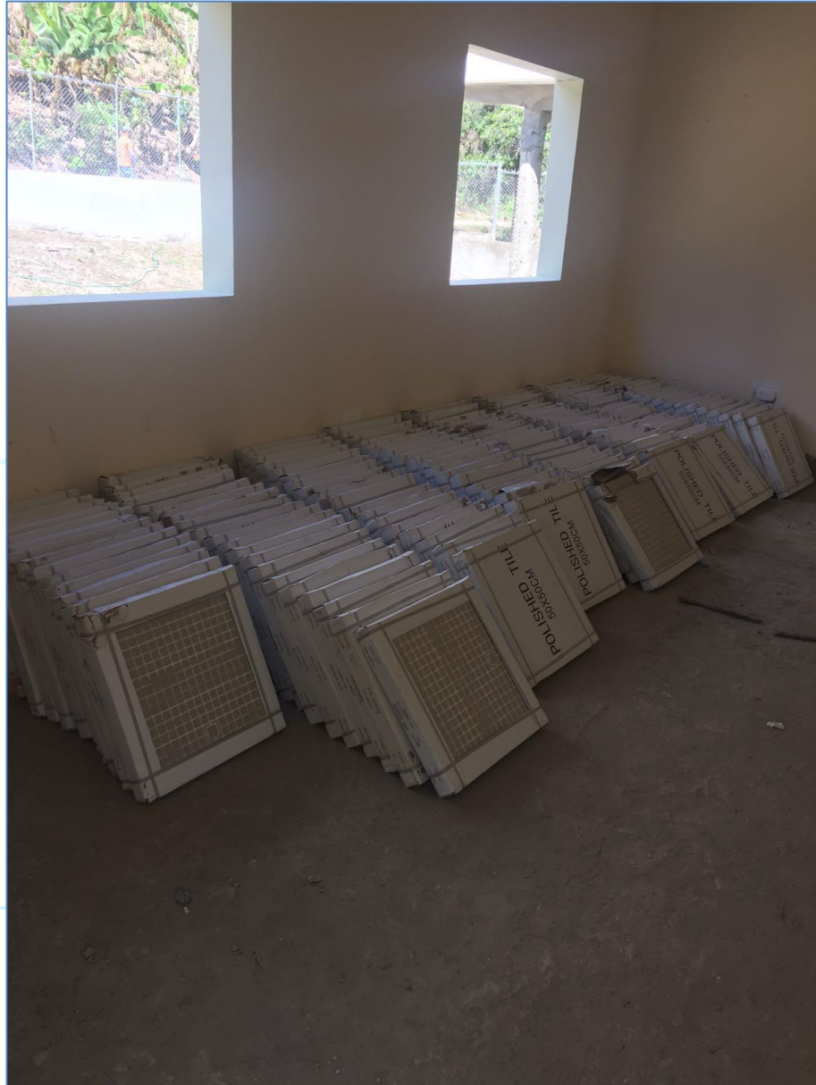
Cerámica de piso, Policlínica Ingenito.