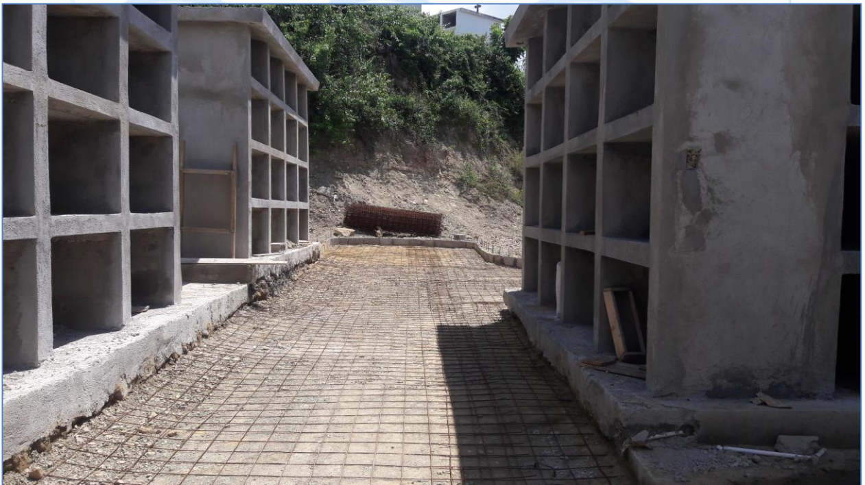
Colocación de malla electro soldada, Cementerio Baitoa.