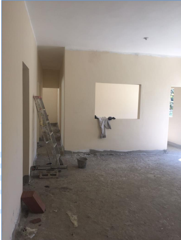
Pintura exterior, Policlínica Ingenito.