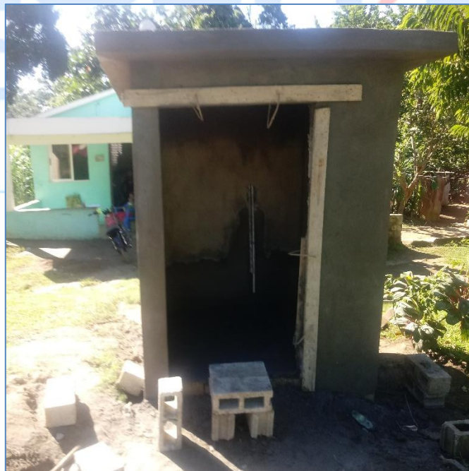
Construcción de caseta para arrancador de la bomba, Solución Agua Potable Vista Hermosa.