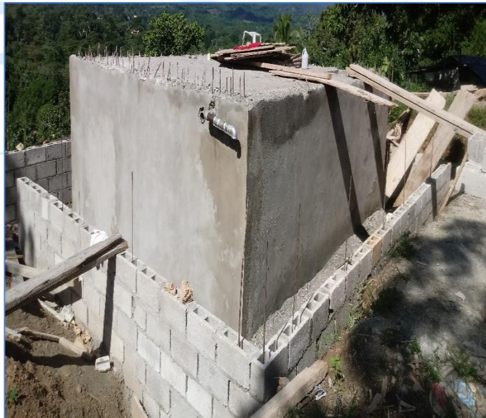
Vaciado de muros de tanque La Cuchilla, Solución Agua Potable Vista Hermosa.