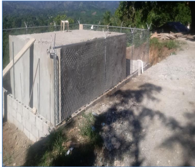
Construcción de verja perimetral, Solución Agua Potable Vista Hermosa.