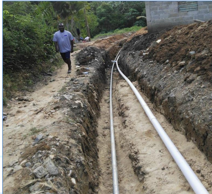
Colocación de tuberías en líneas de impulsión y distribución, Solución Agua Potable Vista Hermosa.