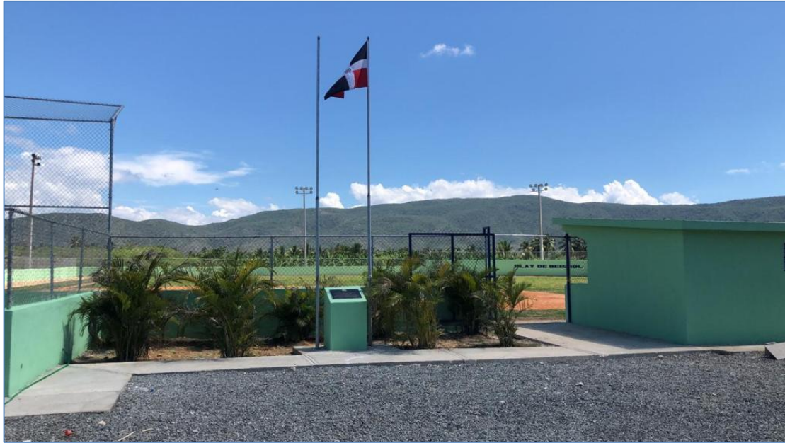
Área de banderas y Tarja, Play de Béisbol en Las Terreras.