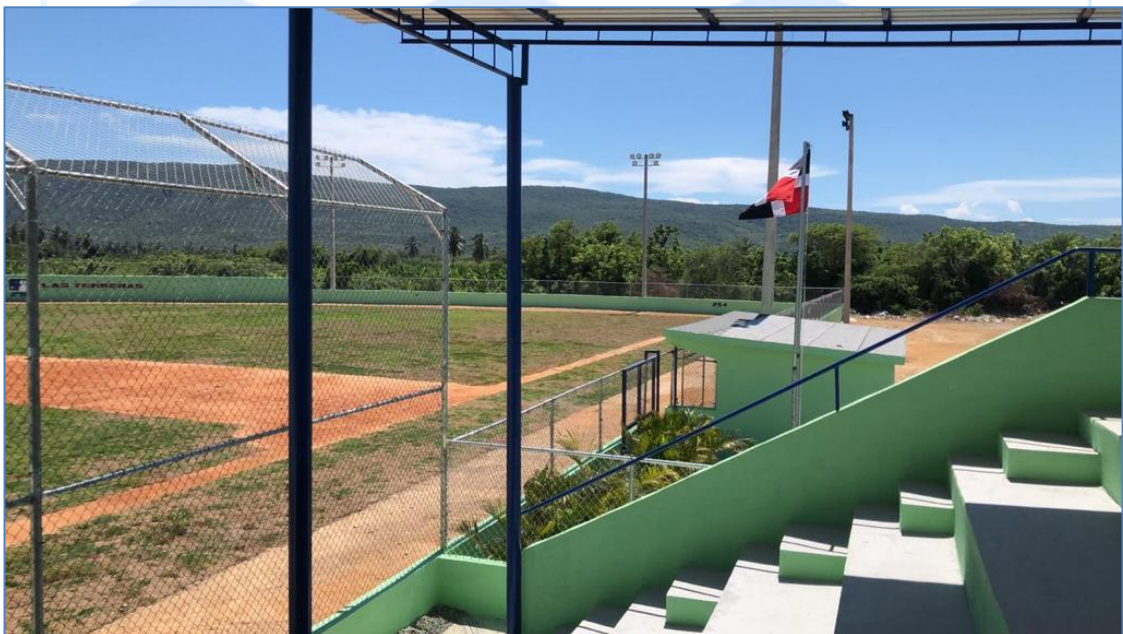
Vista general, Play de Béisbol en las Terreras.