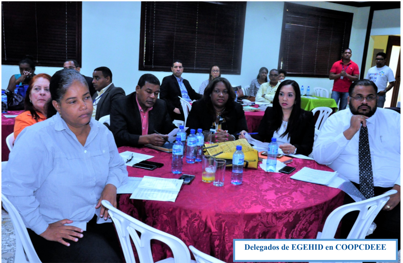
Delegados de EGEHID en COOPCDEEE

Cada delegado de EGEHID ante COOPCDEEE tiene la función de velar por los intereses de sus socios de dicha cooperativa, presentar, aceptar o rechazar la propuestas que se presenten.