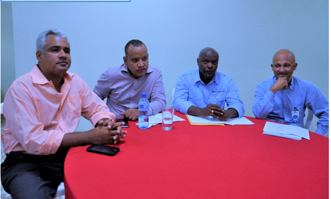
Delegados de EGEHID en COOPCDEEE

Cada delegado de EGEHID ante COOPCDEEE tiene la función de velar por los intereses de sus socios de dicha cooperativa, presentar, aceptar o rechazar la propuestas que se presenten.