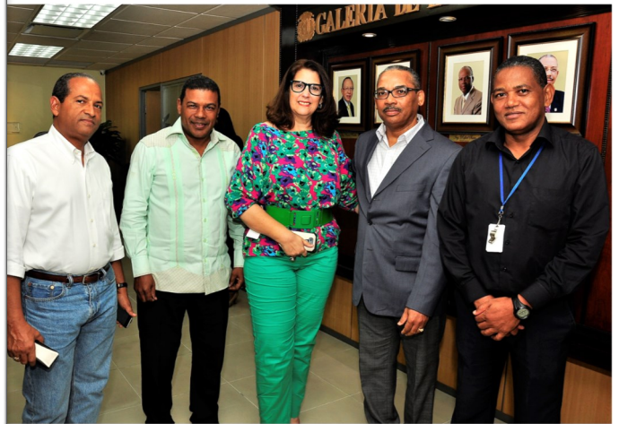
A la inauguración asistieron directores, gerentes, encargados y demás colaboradores de la empresa.