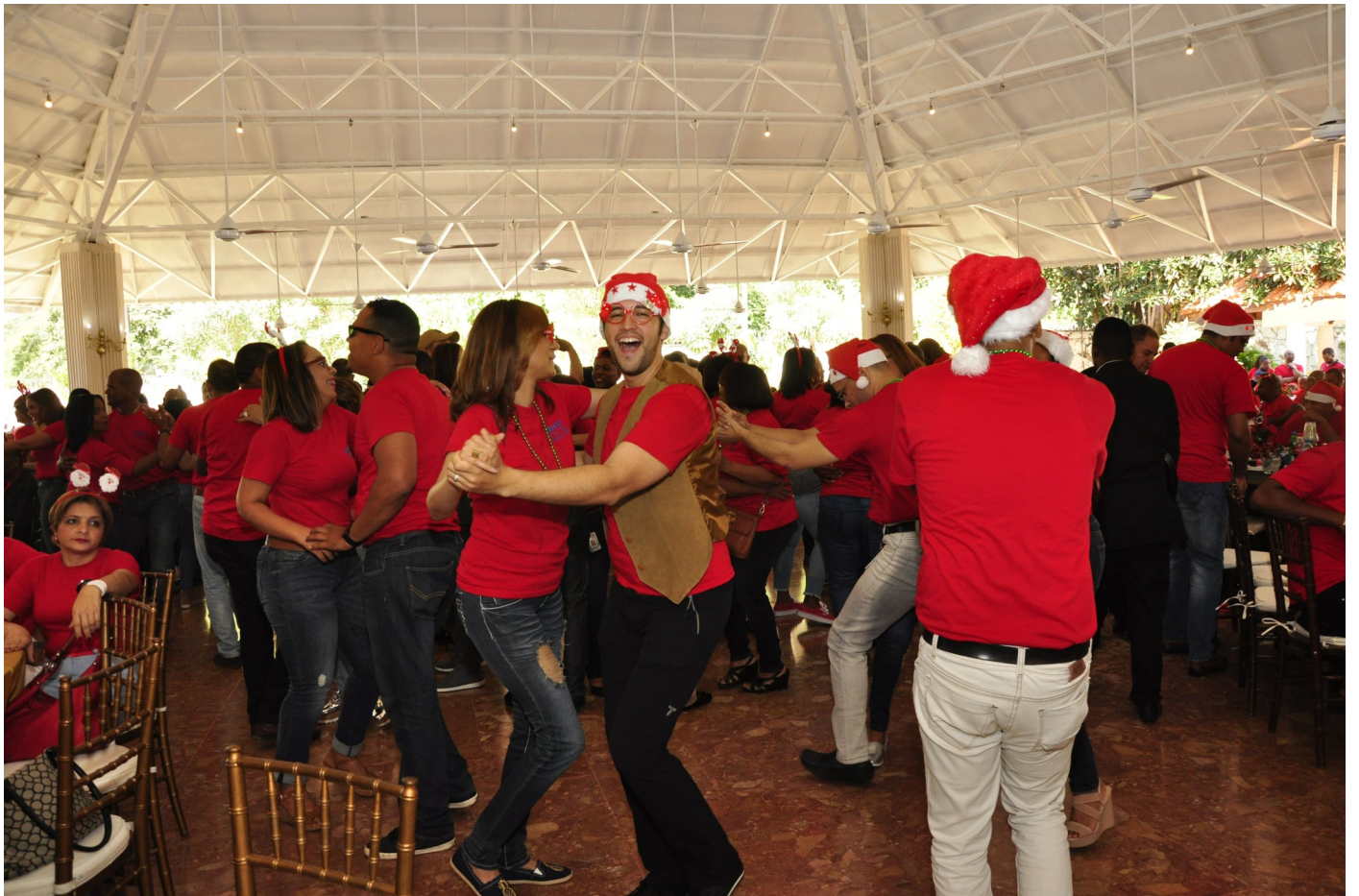
Y se bailó en grande!!!