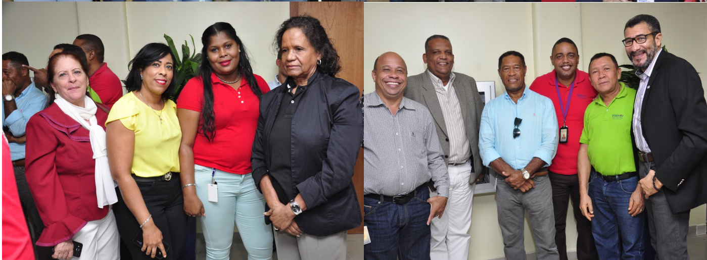
Todos recibieron la llegada de la Navidad con gran júbilo