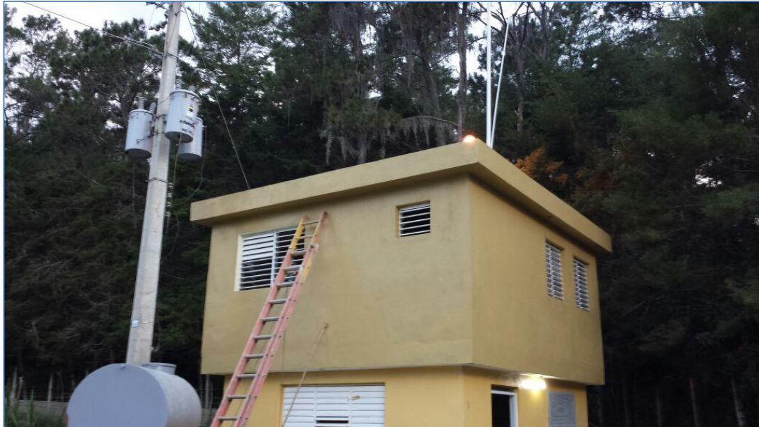
Pintura Exterior, Caseta de guardia en el Salto de Constanza.