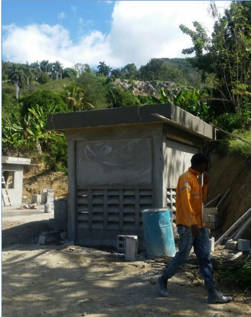
Pañete Exterior caseta de clorificación, Acueducto Sabaneta