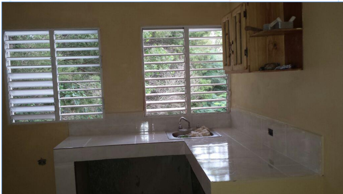
Cocina, Caseta de guardia en el Salto de Constanza.