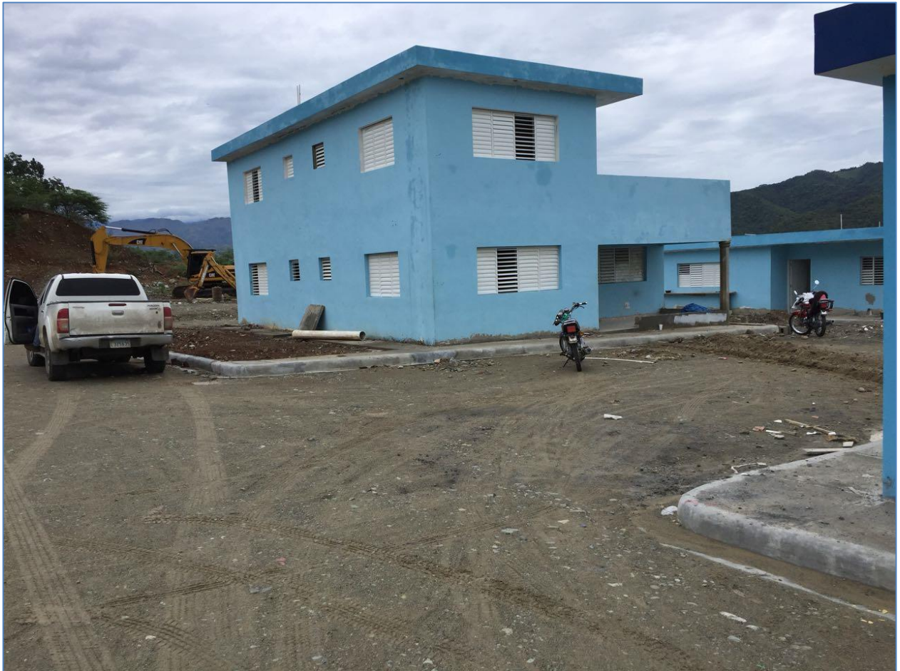
Vista General, Relleno Sanitario Bohechío.