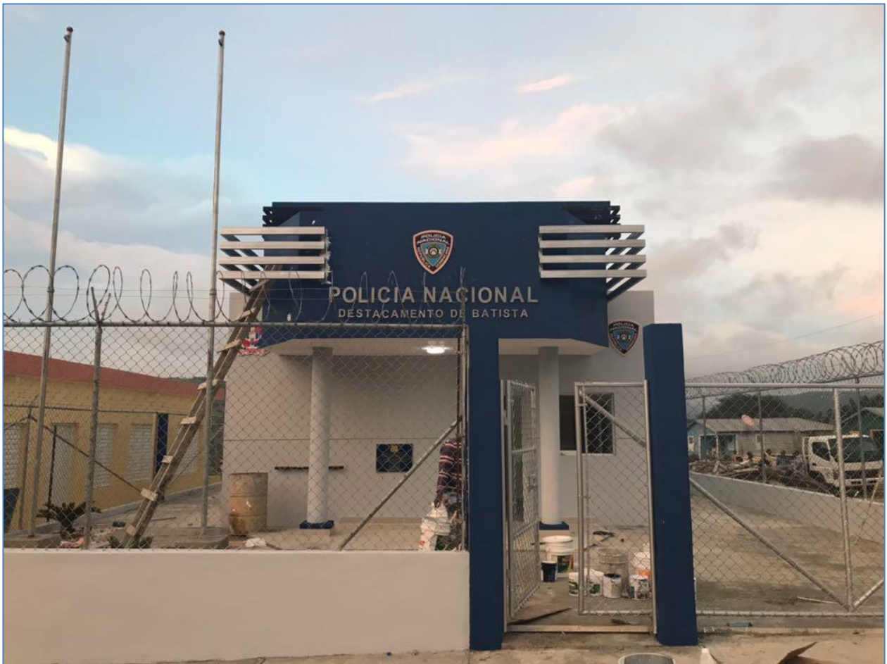
Vista general, Destacamento Batista