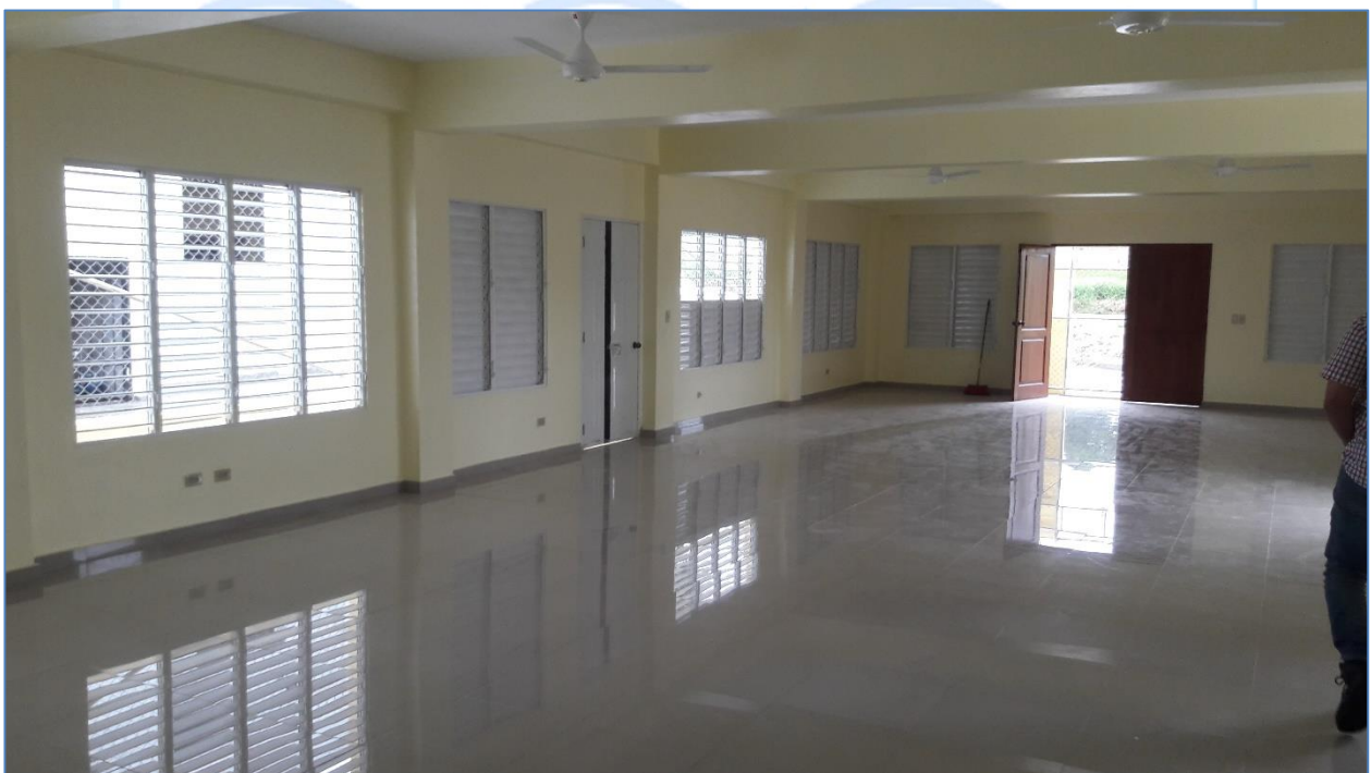
Centro Comunal Batista