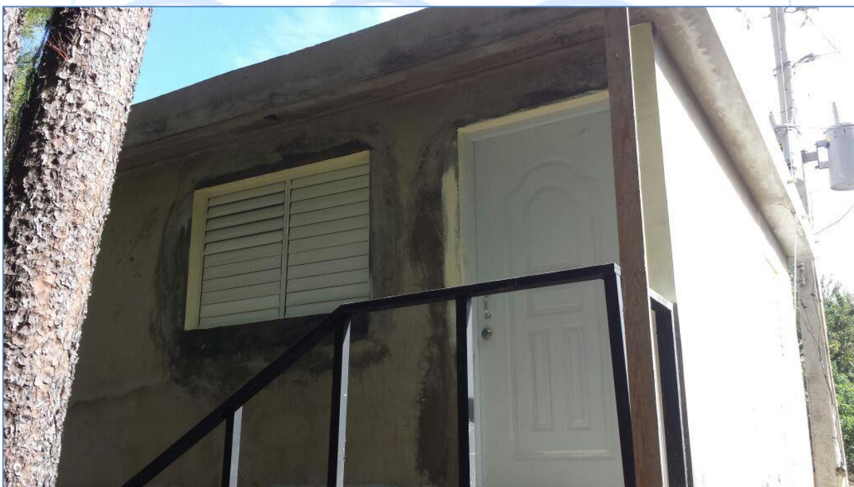
Puertas y ventanas colocadas, Caseta de guardia en el Salto de Constanza.