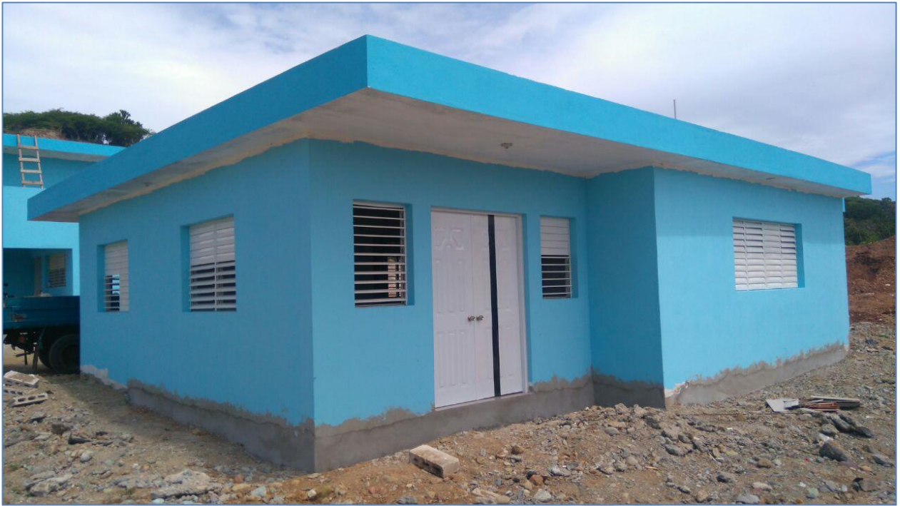
Pintura exterior, ventanas y puertas colocadas, Relleno Sanitario Bohechío.