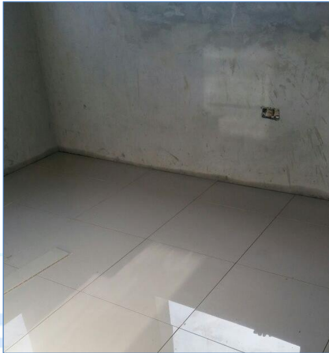
Colocación de cerámica en pisos, Destacamento Batista