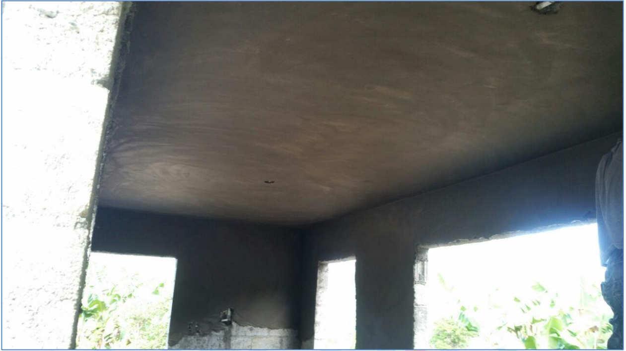
Pañete interior caseta de clorificación, Acueducto Sabaneta.