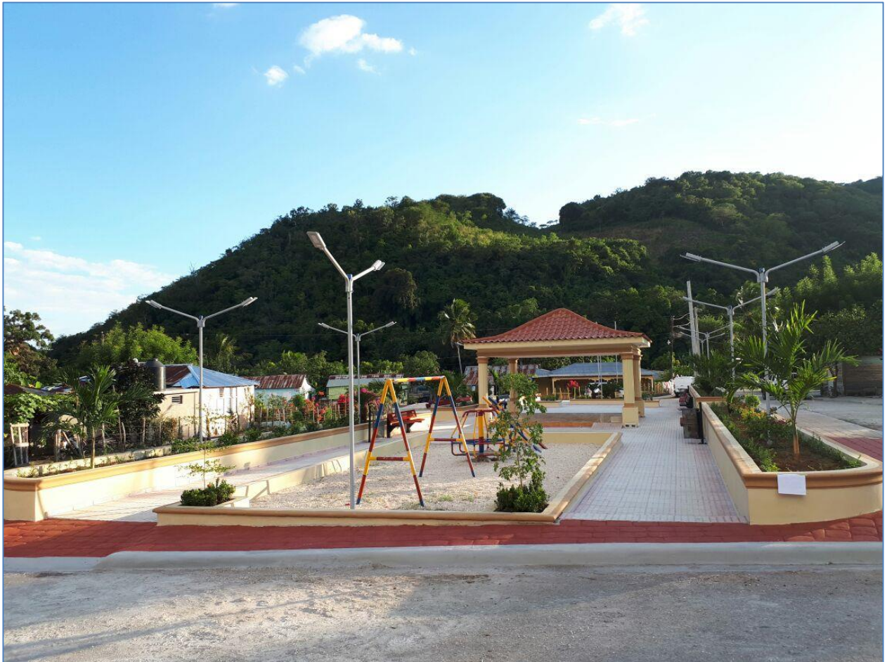
Vista general, Parque Los Cocos.